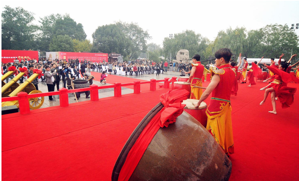
鼓乐中第23届中国绍兴黄酒节开场

“乐绍兴·醉这里”，酒乡绍兴邀请五湖四海的宾客一起，悦一方人，“醉”一座城，在金秋享受微醺。