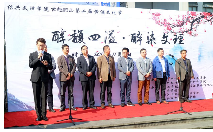
11月2日,“绍兴文理学院古越龙山第二届黄酒文化节”在绍兴文理学院南山校区举行。此次黄酒文化节通过品鉴佳酿、览酒史、赏黄酒工艺品、玩趣味黄酒游戏、描绘浮雕酒、DIY黄酒调制等活动,让师生们寓教于乐,增长黄酒文化知识。