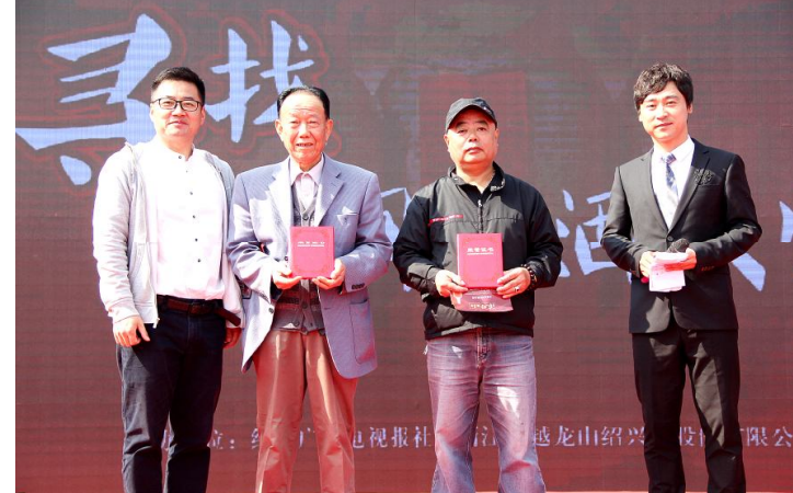
11月4日,绍兴市第二届健康养老博览会在城市广场举行,古越龙山首场“浓好金五年·寻找民间品酒大师”活动拉开序幕。活动现场,黄酒爱好者纷纷当起品酒师,通过精品类、精品牌、猜年份等环节,首场民间品酒大师出炉。据悉,“浓好金五年·寻找民间品酒大师”将在绍兴举办六场评选活动。(刘瑛/办公室)