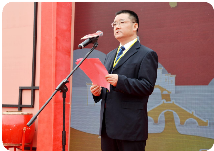
绍兴市副市长陈德洪致辞

放眼东风正劲，中流百舸扬帆。十九大，振聋发聩，走进新时代，万众有统帅。不忘初心，砥砺前行，千亿美元，蓝图绘成。一带一路，黄酒突行，融合发展，升级转型，齐心着力，合作共赢。中国黄酒天下一绝，酒乡佳酿世间极品。 团结精诚，神灵可鉴。一觞一酌，敬祈庇恩。尚飨！